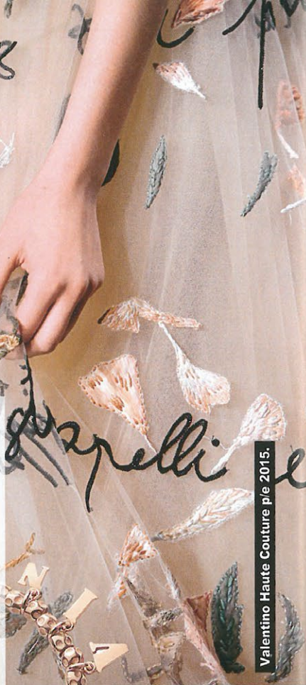
Valentino Haute Couture p/e 2015.